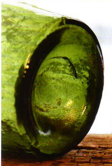
Typischer Pfeifenabriss am Boden einer Flasche