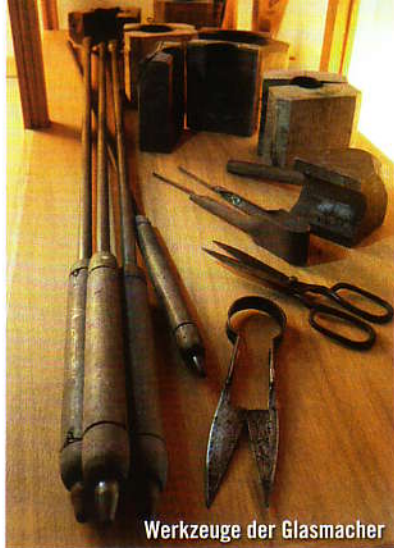
Werkzeuge der Glasmacher