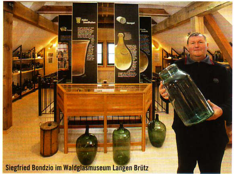
■ Text: Lena Pfannschmidt

Weitere Kontaktadressen von ehemaligen Glashüttenstandorten aus der norddeutschen Region, die heute als Museum oder Schauglashütte dienen, finden Sie unter www.landlust.de . Gegen Einsendung eines mit 0,55 € frankierten Rückumschlags senden wir Ihnen die Liste gerne zu.