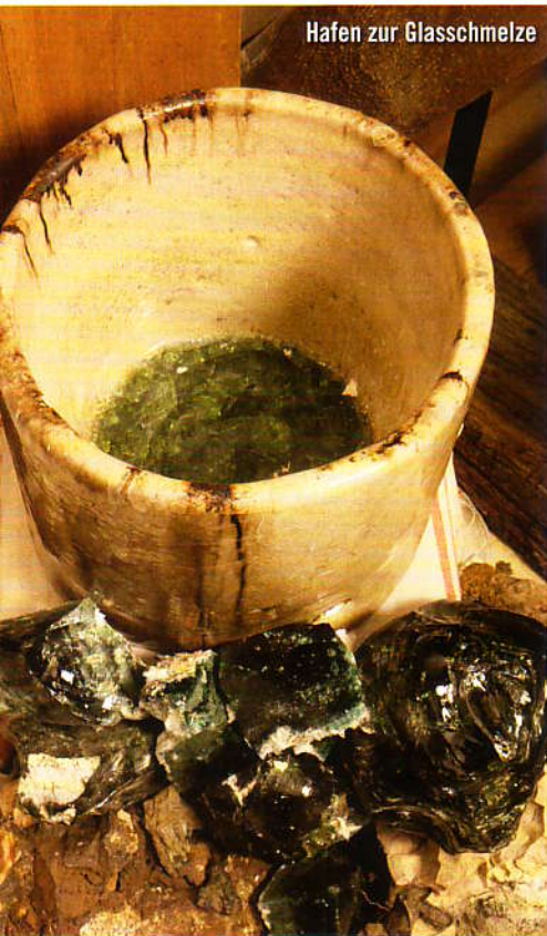
Hafen zur Glasschmelze